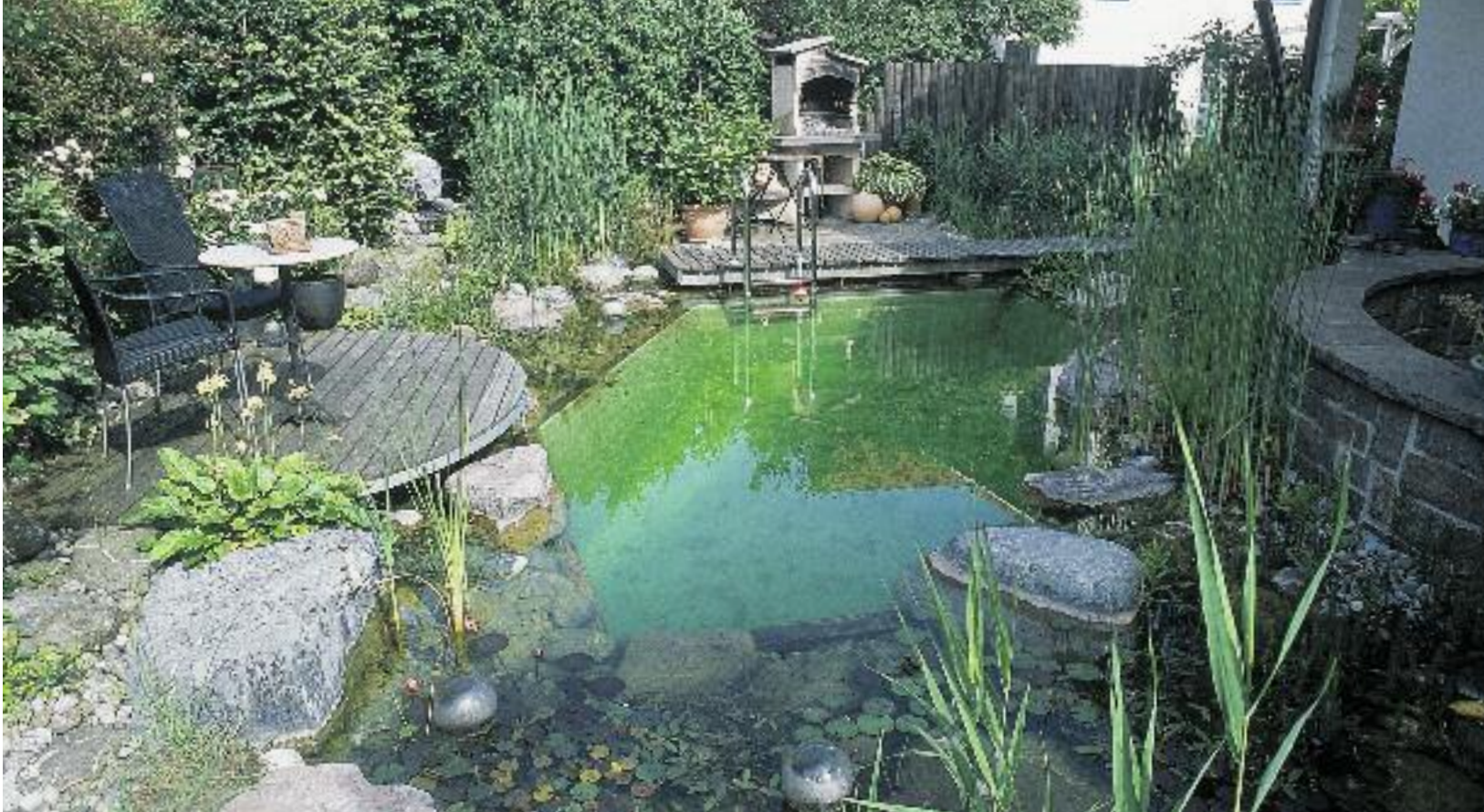
Teich von Susanna und Markus Grob mit lauter Nischen und Wasserpflanzen.

der Gartenweiher mal über die Ufer tritt – das überschüssige Nass landet im Überlauf. Im Sommer lässt Susanna Grob dem Teich einiges an Pflege angedeihen: Sie reinigt täglich den Skimmer, fischt ab und zu Laubblätter oder verfaulte Pflanzenteile aus dem Wasser und setzt zur Reinigung des Schwimmbereichs einmal pro Woche den Teichroboter ein. Im Winter gefriert die Wasseroberfläche, so dass man darauf stehen kann. Die Umwälzung über Quellstein und Bachlauf wird aber fortgesetzt. Die meisten Pflanzen schneidet Susanna Grob schon im Herbst zurück, damit keine zersetzten Nährstoffe in den Teich gelangen. Von Schilf und Rohrkolben lässt sie aber einige Halme stehen: «Sie sehen wunderschön aus, wie sie aus der Eisdecke ragen», sagt sie.